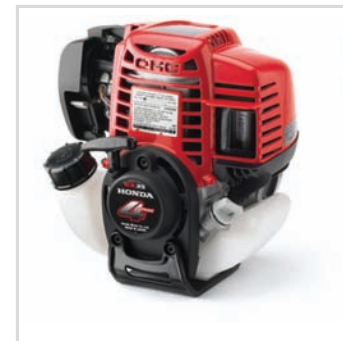
MOTOR HONDA GX 35