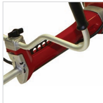
ANTIVIBRAČNÍ ULOŽENÍ RUKOJETÍ